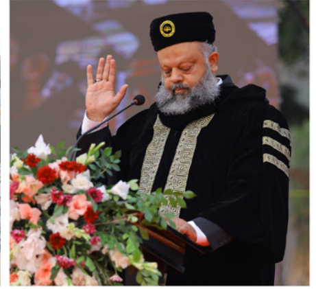
یونیورسٹی کے ریکٹر پروفیسر ڈاکٹر سید عامر گیلانی نئے گریجویٹس سے حلف لے رہیں۔