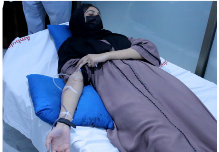
TUFIANS donating blood for Thalassemia patients