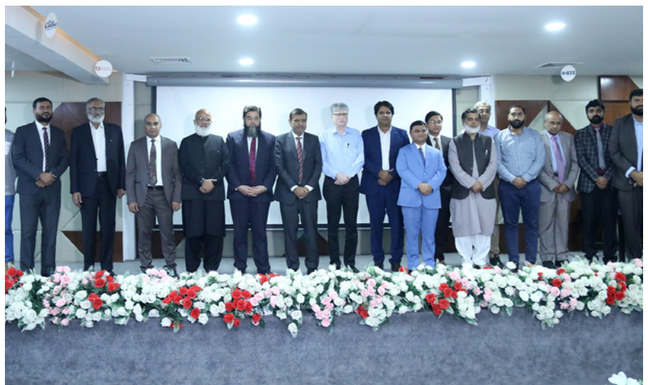
Group photo – Guest Speakers with faculty members of TUF