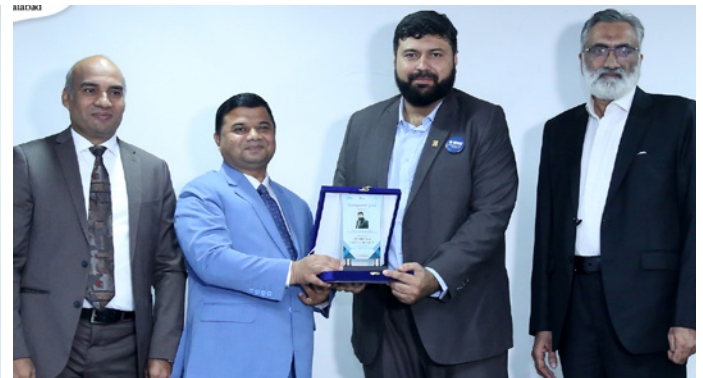
University mementos being presented to the guests