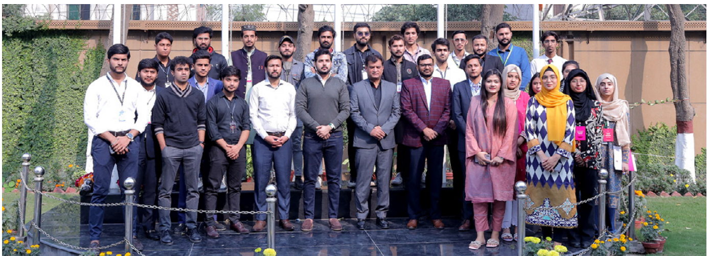
Participants with chief guest and guest speakers of training session.

TUF Entrepreneurship society for organizing such an intellectually stimulating event. The session was very informative and attended by large numbers of students.