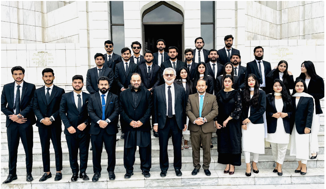
TUF Law students during visit of the Supreme Court of Pakistan.