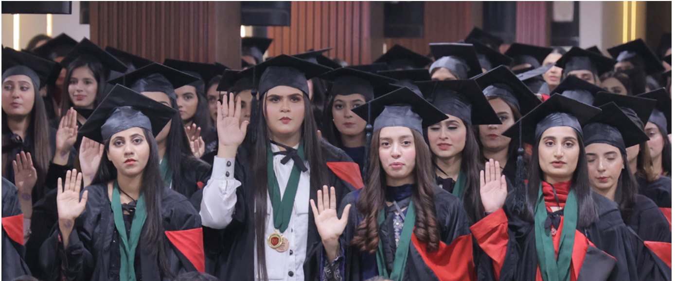
Fresh doctors taking Oath