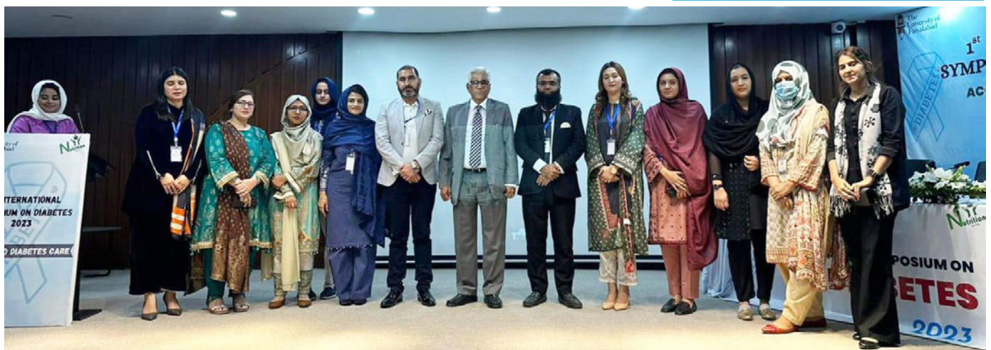
Group photo – Guest Speakers with faculty members of TUF