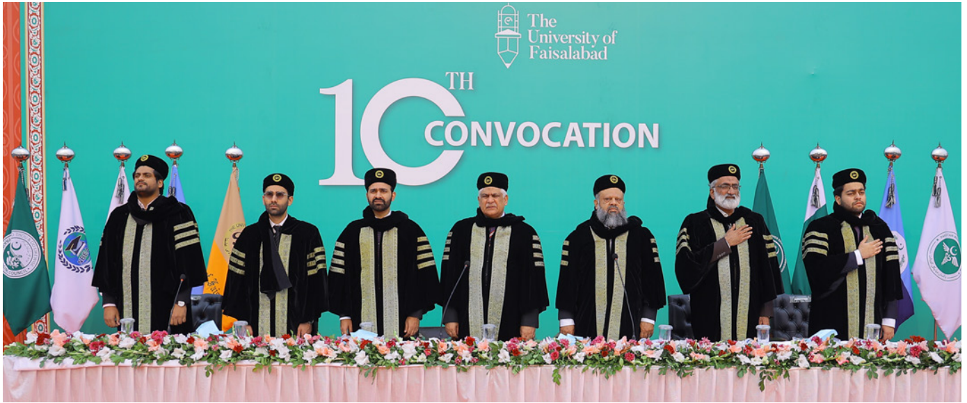
Patron in Chief, Chairman and Members of BOG with others at 10th Convocation of TUF

The University of Faisalabad proudly celebrated its 10th Convocation, a momentous occasion that not only marked the academic accomplishments of 1701 students but also commemorated 21 years of the institution's commitment to excellence in education. The ceremony, held at the university arena, was graced by distinguished dignitaries, faculty, and the proud families of the graduates.