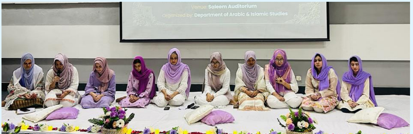
Students offering Manaqib of Syeda Fatima Zahra (S.A)