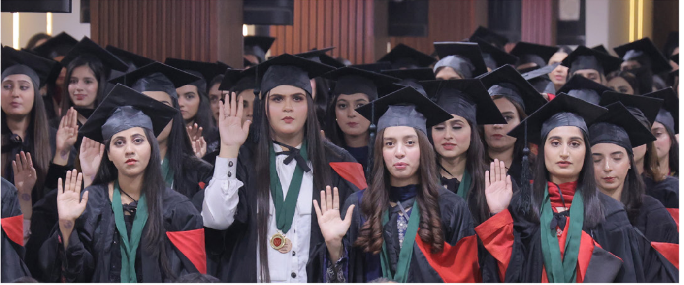
یونیورسٹی میڈیکل اینڈ ڈینٹل کالج کی گریجویٹس بحیثیت ڈاکٹرز دکھی انسانیت کی خدمت کرنے کا حلف اٹھا رہی ہیں

محنت اور قابلیت سے دکھی انسانیت کی خدمت کرنے کی تاکید کی۔ تقریب میں نئی ڈاکٹرز سے پیشے اور ذمہ داریوں سے مخلص رہنے اور انسانیت کی خدمت کا حلف بھی لیا گیا۔ اس موقع پر پروفیسر ڈاکٹر احسن وحید راٹھور نے میڈیکل کالج کی نئی لائبریری «شہر بانو رضی اللہ عنہ لائبریری» کا افتتاح بھی کیا۔ اس تقریب میں فیصل آباد میڈیکل یونیورسٹی کے وائس چانسلر پروفیسر ڈاکٹر ظفر چوہدری، سی پی ایس پی کے ریجنل ڈائریکٹر پروفیسر ڈاکٹر اصغر بٹ، ابو عمادہ میڈیکل اینڈ ڈینٹل کالج لاہور کے پرنسپل پروفیسر ڈاکٹر طارق بھٹی اور عزیز فاطمہ میڈیکل اینڈ ڈینٹل کالج کے پرنسپل پروفیسر ڈاکٹر محمد سعید نے بھی خصوصی طور پر شرکت۔ کانووکیشن کے اختتام پر شرکاء کیلئے پر تکلف ضیافت کا اہتمام بھی کیا گیا تھا۔